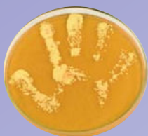
Handabklatsch ohne Seifenwaschung oder Desinfektion

Mit ihrer „Clean Care is Safer Care“-Initiative startete die WHO 2005 eine weltweite Kampagne für mehr Patientensicherheit. Im Mittelpunkt steht die Verbesserung der Händedesinfektion, da diese einen direkten Einfluss auf die Übertragung pathogener Erreger hat. Für dieses Ziel wurde das Konzept der „5 Momente der Händedesinfektion“ entwickelt (1).