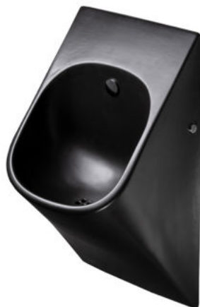
SLP 89S - LA FONTANA