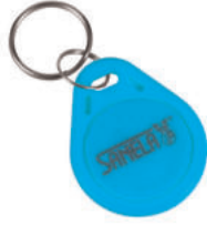
1 Stück aus Set von 50 Stück des Jetons SLZA 51B