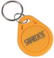
1 Stück aus Set von 50 Stück des Jetons SLZA 51